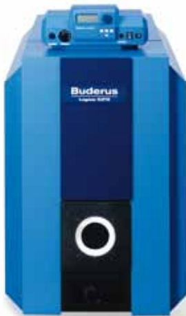
Logano G215 WS

Dodatno, Buderus specijalni sivi lijev pruža visoku otpornost za robustan način rada i kod niskotemperaturnog pogona, bez ograničenja donje temperature.