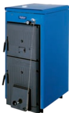
Logano G211 može se dobiti u pet veličina učinaka

Logano G211 se može bez problema uklopiti u vašu postojeću instalaciju grijanja i lako instalirati. Veliki i lako dostupan prostor za punjenje i ložišni prostor, pojednostavljuje i čini rukovanje udobnijim. Lijevani kotao Logano G211 ispunjava što je obećao – ugodnu toplinu, zimu za zimom.