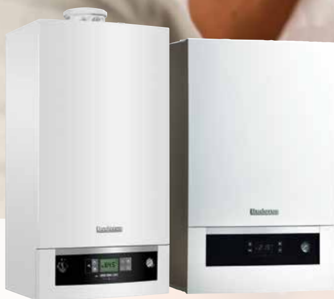
Logamax plus GB072 Logamax plus GB012

Buderus kondenzacijski uređaji: opremljeni za postizanje optimalne energetske bilance